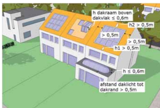
Daglichtvoorzieningen die voldoen aan de maatvoering in deze tekening mogen zonder omgevingsvergunning worden gebouwd'

Alleen als voldaan wordt aan alle genoemde voorwaarden mag u de daglichtvoorziening zonder vergunning plaatsen. Deze voorwaarden gelden ook als u zonder omgevingsvergunning iets wilt veranderen aan een bestaande daglichtvoorziening. Vergunningvrij bouwen is niet toegestaan op, aan of bij een bouwwerk dat illegaal gebouwd is of gebruikt wordt.